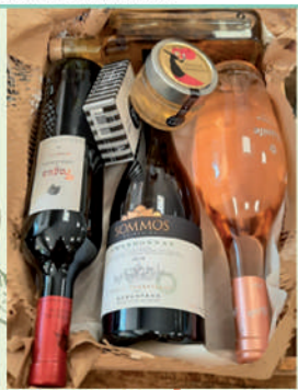
CATAS de vino para grupos