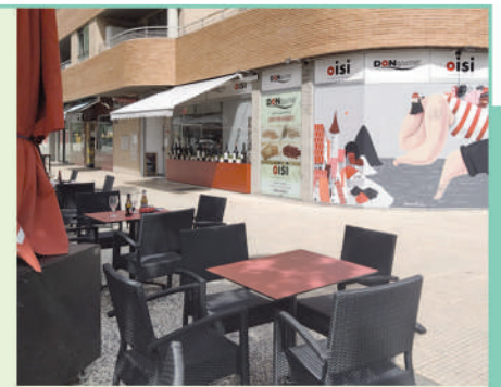
SABORES GOURMET para disfrutar