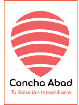
Concha Abad Tu Solución Inmobiliaria